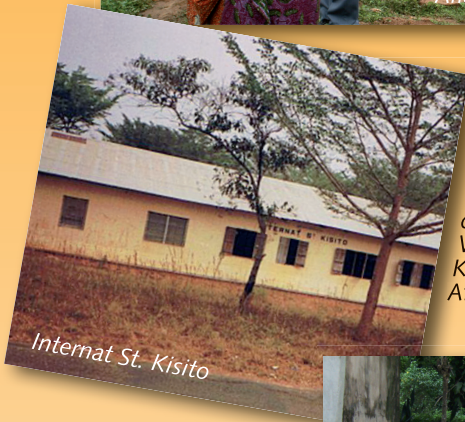
Internat St. Kisito

Im Hochland des westafrikanischen Landes (ca. 1000m über NN) unterstützt die Kolpingsfamilie Woffenbach einen Kirchenbau in Afiadeniygba.